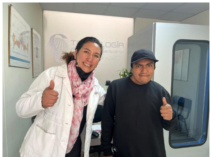
Die Hörspezialistin und Joel sind mit dem Resultat zufrieden. Dank der Hörgeräte hat Joel nun eine Hörfähigkeit von 80% statt wie bisher nur 30%.