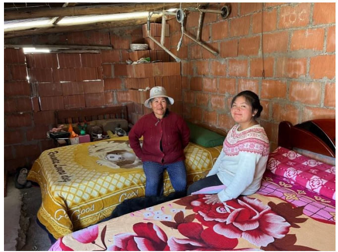
Mutter und Tochter sind glücklich, dass sie jetzt neue und saubere Betten haben. Ebenfalls halfen wir ihnen im Haus «auszumisten», damit sie mehr Platz haben.