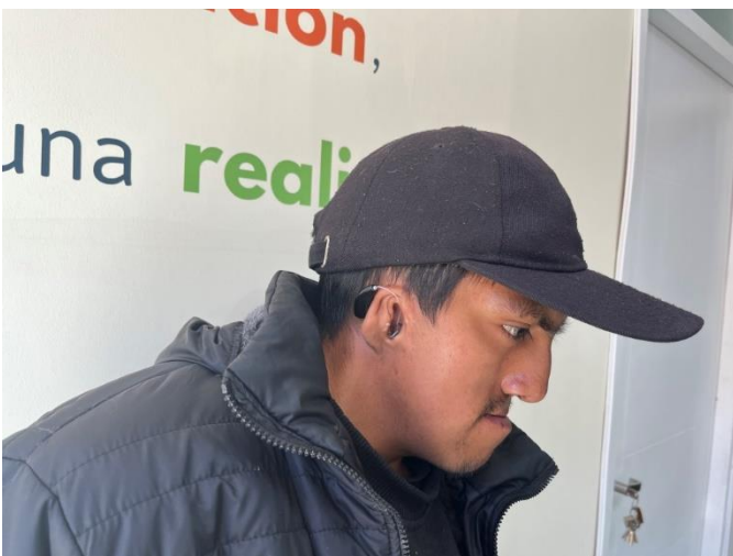
Trotz deformierter Ohrmuschel am rechten Ohr hält das Hörgerät gut im Innenohr, weil das Gerät speziell für den jungen Mann angefertigt wurde.

Die Kosten für die beiden Hörgeräte beliefen sich auf CHF 1500, im Preis inbegriffen sind zwei Jahre Garantie sowie zwei Jahre Gratisbatterien, welche wir nach Ablauf weiterhin finanzieren werden.