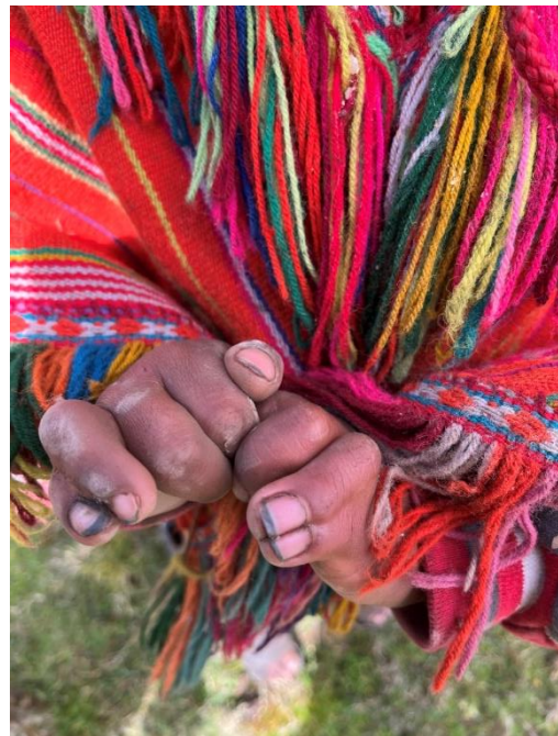
....seine Klein- und Ringfinger an beiden Händen zusammengewachsen sind.