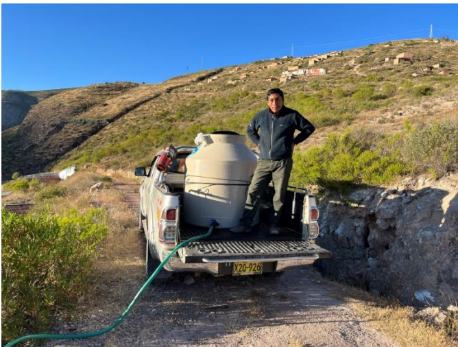
Unser Mitarbeiter mit dem Wassertank auf unserem Fahrzeug. Der Schlauch dient zum Übertragen des Wassers in den zweiten Wassertank bei der Hütte, die 50 Meter weiter unten liegt.