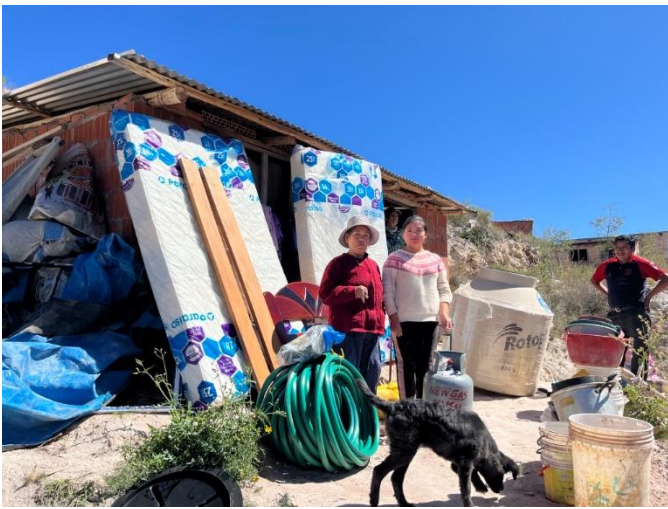
Material, das wir eingekauft haben. Auf dem Bild ist nur einer der beiden Wassertanks zu sehen, der zweite wurde später noch angeschafft.