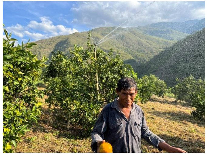
Glücklicher Bauer mit einer seiner 6 Sprinkleranlagen. Er pflanzt vor allem Zitrusfrüchte an, die er verkauft.