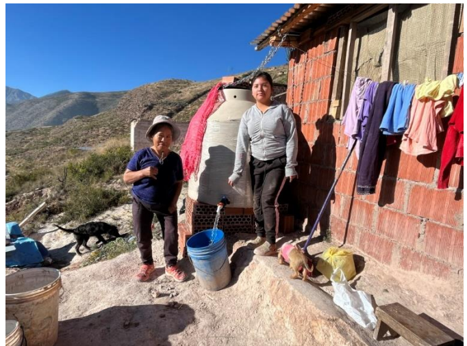
Fix installierter Wassertank bei der Hütte, der von uns gerade befüllt wurde. Die 600 Liter Wasser reichen für knapp einen Monat. Nun sind auch Wäschewaschen und Körperhygiene regelmässig möglich!