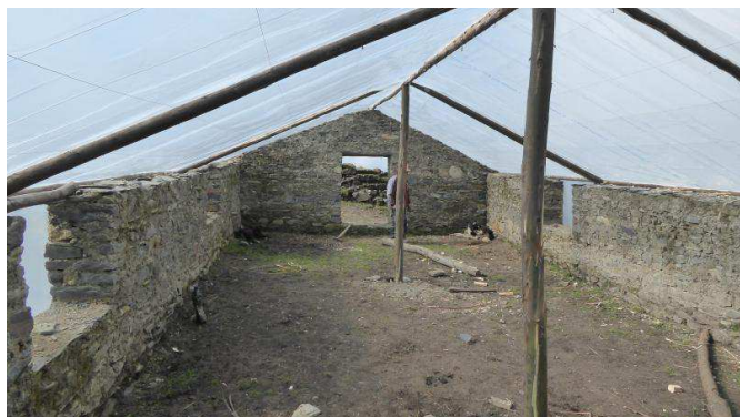
Vista del interior.