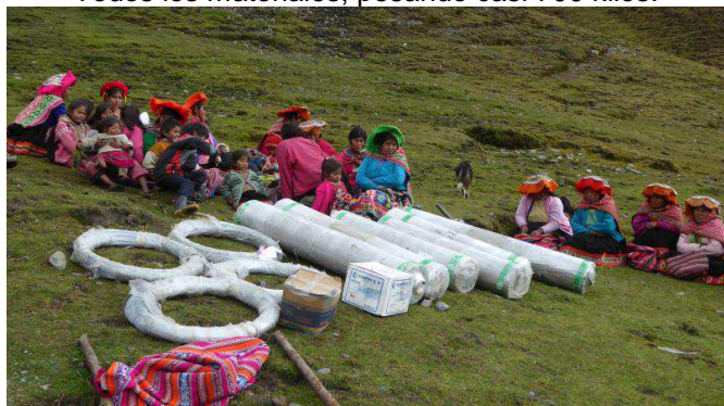
Todos los materiales, pesando casi 700 kilos.