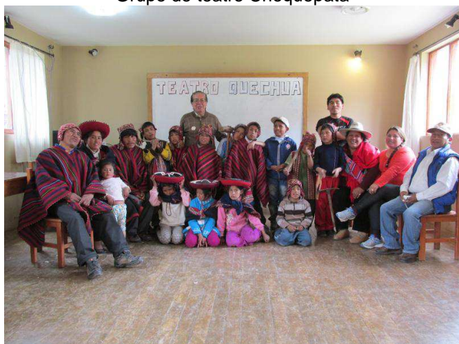
Grupo de teatro Choquepata