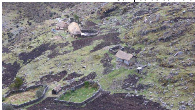
Campos de cultivo de papas a 4000 m.s.n.m.

La pequeña comunidad campesina de Pitukiska está ubicada a una altura de 4100 m.s.n.m. En estas partes altas de los Andes, lo único que los habitantes pueden cultivar son papas. No se pueden cultivar otras verduras ya que la tierra no es la adecuada. Además, las condiciones extremas del clima no son ideales para cultivar verduras en campo abierto (por la helada de noche, la radiación UV de día, etc.).