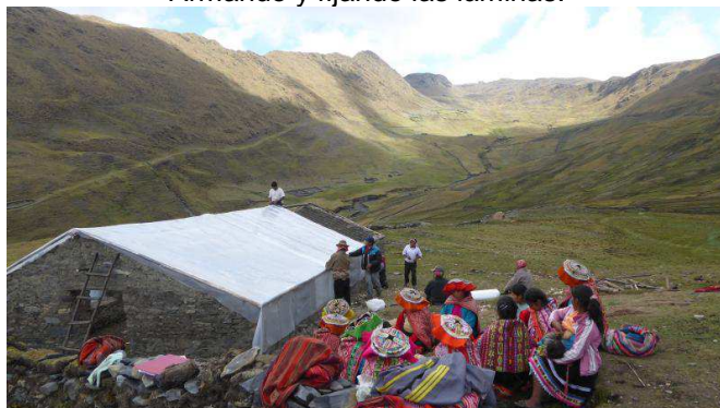
Armando y fijando las láminas.